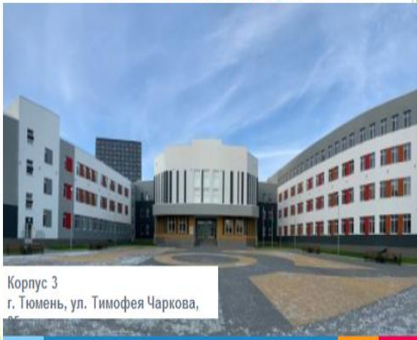
Корпус 3 г. Тюмень, ул. Тимофея Чаркова,