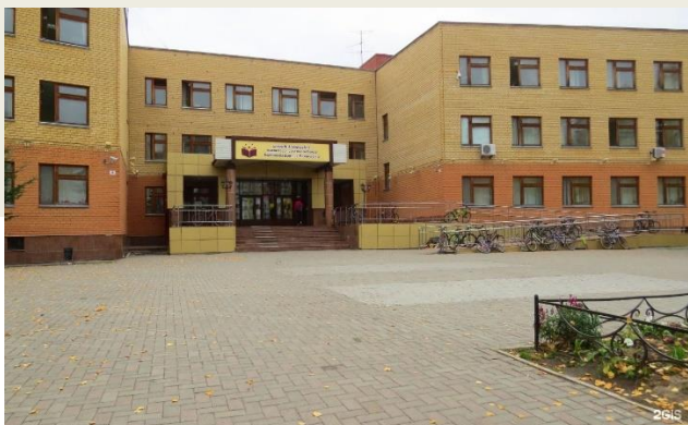
МАОУ СОШ № 48 города Тюмени имени Героя Советского Союза Д.М. Карбышева (2 корпус)