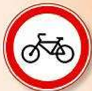
"ДВИЖЕНИЕ НА ВЕЛОСИПЕДАХ ЗАПРЕЩЕНО"

• Если для велосипедистов установлены специальные светофоры, то такой перекресток называется регулируемым .