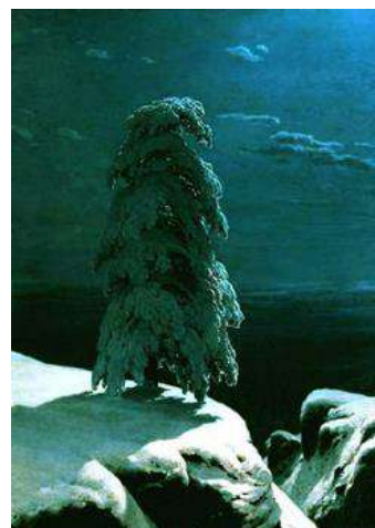
Иван Шишкин. На Севере диком..., 1891.

Творческая составляющая задания может быть усложнена предложением составить словесное описание замысла пейзажа – как заказа художнику, указав желаемую композицию, ракурс, характерные черты изображаемого и способы их достижения.