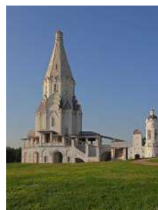
3. Церковь Вознесения Господня в Коломенском (Москва)