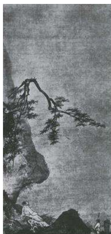
Ма Юань. Лунный свет. Живопись тушью на шелке. XII-XIII вв.

2. Какие эмоциональные доминанты, по Вашему мнению, существуют в каждом произведении?