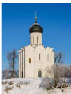
2. Храм Покрова Пресвятой Богородицы на Нерли