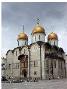
1. Успенский собор в Московском Кремле